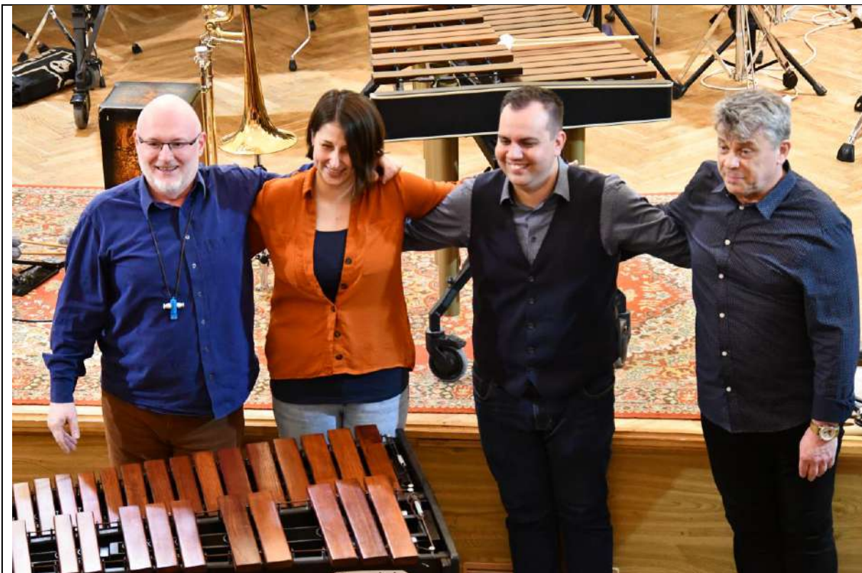
Balázs Oszkár Fesztivál: