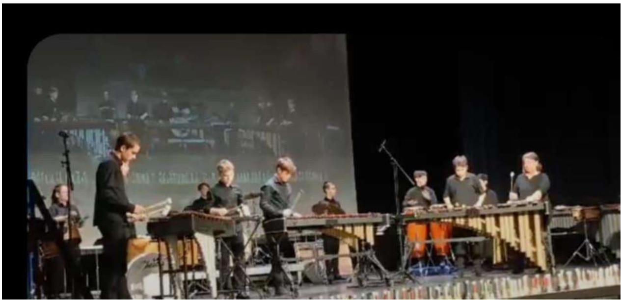
Ütő tanszaki koncert: